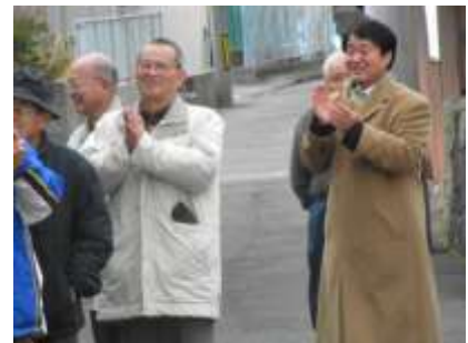
きらりと光る紅一点