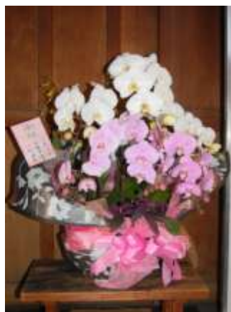
小形（故）さん家族からお祝いの。 花が届きました