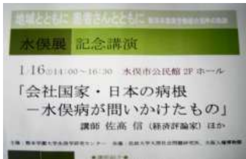
佐高 信氏（経済評論家）記念講演