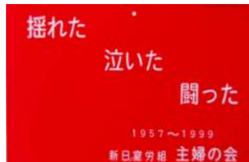
1999年主婦の会解散時の記念品