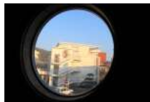
水俣の婦人会館（築60年？） が展示場になりました。 モダンな設計、丸窓があります