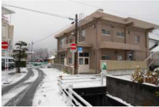
1月13日は珍しく水俣にも5cmの雪が積もりました。 水俣現地センター