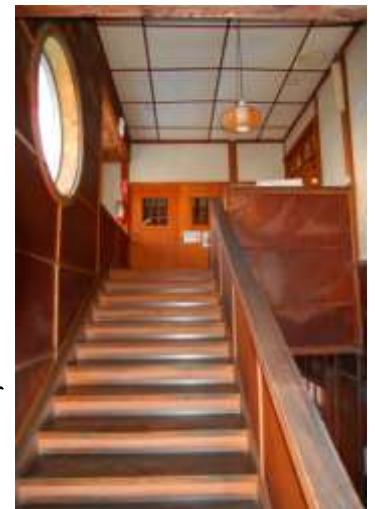
私はこの婦人会館で結婚式をしたんですよ。（女性来館者） なつかしか！