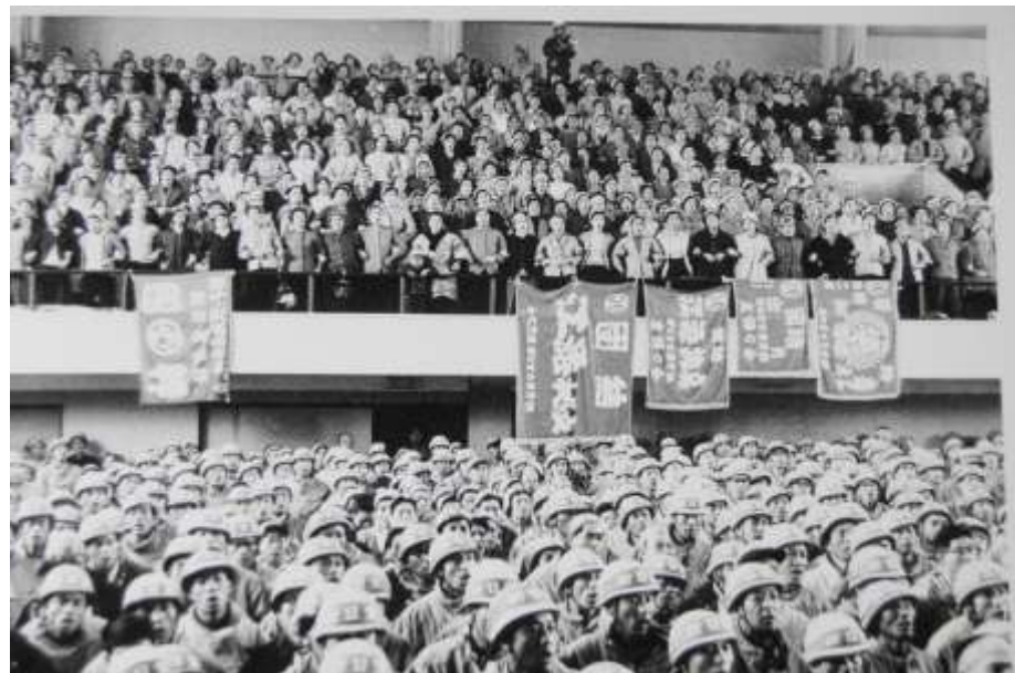
昭和37年（1962）の組合大会：水俣市体育館