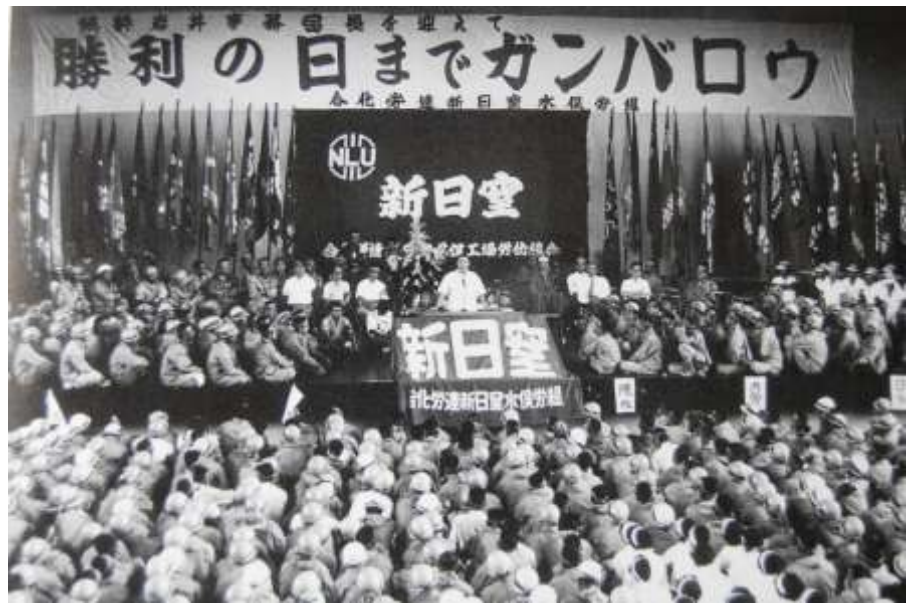
183日間のストライキ。安定賃金闘争