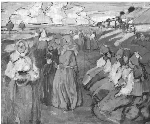
《トロイツアの祝日 Троицын день》(習作; 1907)