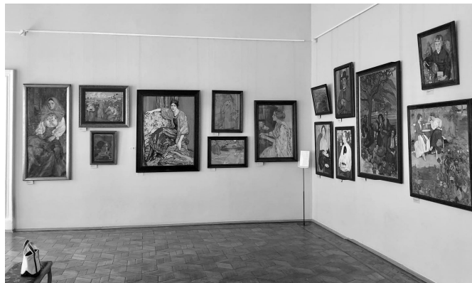
ヴォローネジ州美術館, エレナ・キセリョーフの間 1)

2019年9月9日から11日まで、熊本学園大学海外事情研究所の海外調査研究費助成を受けてヴォローネジ市に滞在した。二度目である。前年18年9月8日に、ヴォ