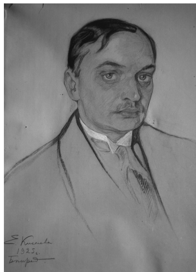
アントン・ビリモーフの肖像 (1925, ベオグラード) 18)

2017年にロシア語で出た回想録によると、マティチは二人と1965年にベオグラードで知り合った。キセリョーフはマティチに、クオッカラでのエピソードを語った。恩師のレーピンのこと、お気に入りの教え子のキセリョーフに少しばかり言い寄ることもあった。マヤコーフスキーやチュコーフスキーのこと、あるとき三人で浜辺を散歩していると、マヤコーフスキーがいきなりつねってきた。チュコーフスキーと親し