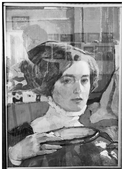
《碧の花瓶を持つ画家、自画像 Художница с зелёной вазой. Автопортрет》(1910)