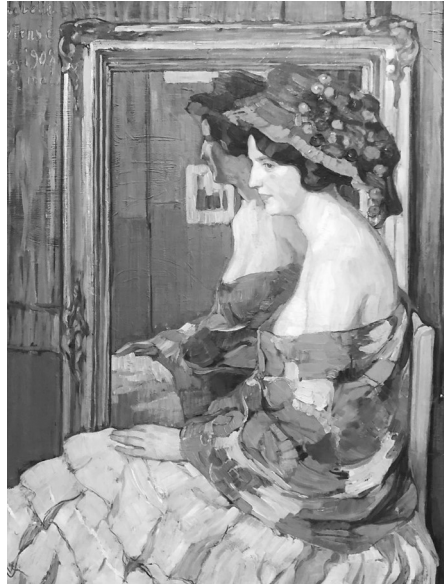
《麗しの紫陽花 (美人のオルタンス) Прекрасная Гортензия (La Belle Hortense)》(1908)

フスキー、ウリヤーノフ、ソーモフ、スデイキン、ゴロヴィーン、バクストと並んで作品が誌上に掲載された 3) 。ロシア語の画題は「紫陽花」とされているが、モデルの女性(オルタンスという名前か)を花に見立てたのだろう、胸元を覆う上掛けの色彩の斑点と白い肌が鏡に映りこみ、白い方形を積み重ねたかのような手前のドレスの襞と相まって、独特の効果をあげている。13年、パリで《マルーシャ》を制作、また数学者のアントン・ビリモーフと知り合い、二年後の15年、かれの住むオデッサへ移った。