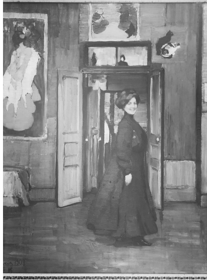
《居室で，自画像 У себя Автопортрет》(1908)

たちは「民衆」の生活に寄せる関心、「プリミティヴ」や「原始回帰」への視点のある点で、ゴーギャンの描いたブルターニュの農婦たちとパラレルな関係にある。