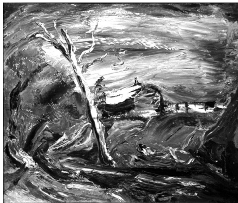
ドレーヴィン《アルタイ・枯れた白樺》(1930):ロシアン・アート美術館(エレヴァン)

このようにロシアン・アート美術館には、マレーヴィチ、タートリン、ロートチェンコなど、ロシア・アヴァンギャルド芸術のいまや「登録商標」ともいべきアーティストの作品はない。そのかわり、ロシア美術が空前の飛躍を見せた1890年代末から1930年代初め(アブラミヤンはこの三十数年を「もっとも自由で真正きわまりない時期」 20) とみなした)にかけて、「芸術世界」「ロシア芸術家同盟」からはじまり、「青い薔薇」を経て「ダイヤのジャック」「ロバの尻尾」など第一次世界大戦前のグループへ続き、その後「フィチエ」「マーコヴェツ」「ジャール・ツヴェート」「四つの芸術」さらに「モスクワ芸術家協会(OMX)」「イーゼル画家協会(OCT)」などへ受け継がれていく二十世紀ロシア美術史でもいちばんに多彩で豊穡な芸術潮流 21) 、その代表者たちの作品が目白押しなのである。アブラミヤンの「目」の確かさと、二十世紀ロシア美術史を歴史の時間軸からホール空間軸へ転換し、壁面に色彩・フォルムの響和と対位法を奏でさせたいというコレクションの意図が、ホールを歩いていると明確に受け止められてくる。