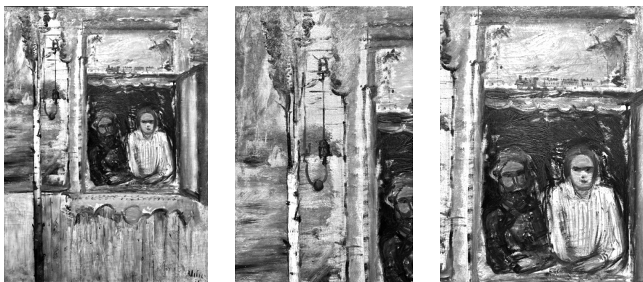
ラバース 《転輸手と妻》(全体と部分;1928):ロシアン・アート美術館(エレヴァン)

そのほか「なにかの意志をおびている」 19) かのような筆運びの生々しい一回性のリ