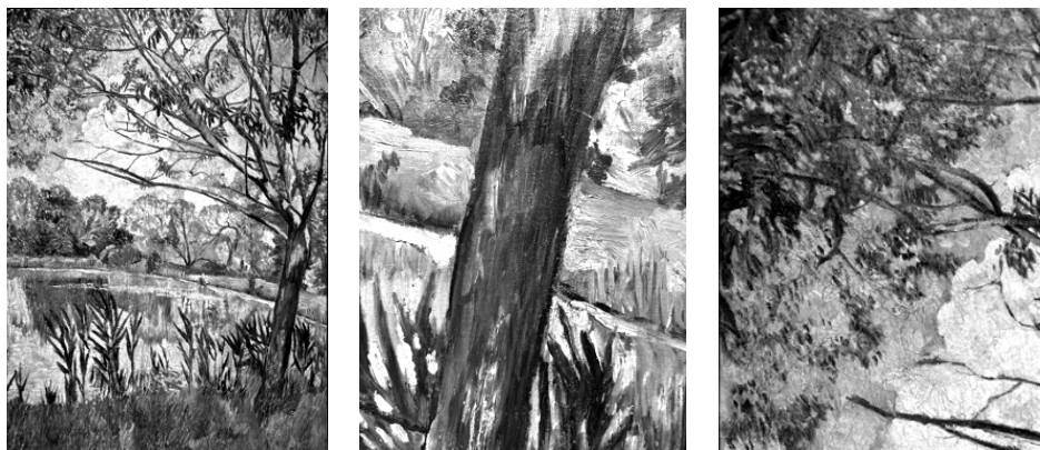
ゴンチャロフ 《池》(全体と部分;1906):ロシアン・アート美術館(エレヴァン)

この二人の画家のほか、彼らとともに「ダイヤのジャック」に参加したアリストルフ・レントウーロフ(1882-1943)やイリヤ・マシコーフ(1881-1944)、ピョートル・コンチャロフスキー(1876-1956)、アレクサンドル・クプリーン(1880-1960)、アレクサンドル・オスミョールキン(1892-1953)、そしてファーリクの作品が充実している。先述のとおり、コレクションにはレントウーロフの作品が七点あり、他の主要画家の所蔵作品数よりも多い。マシコーフは三点、コンチャロフスキーとオスミョールキンは四点、クプリーンは五点ある。六点所蔵されるファーリクの作品とともに、彼らの作品を見ることで「《ダイヤのジャック》の代表者たちによる全体的発展の合法則性を目で追う」 18) ことができる。