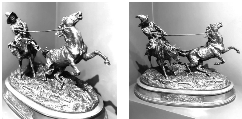
E. A. ランセレ 《馬の調教師》(制作年不明): ロシアン・アート美術館 (エレヴァン) 6)

いまやピロスマニは、ジョージア絵画を語るうえで不可欠のアイコンである。ソ連による抑圧的芸術政策にもかかわらず、ジョージア芸術は独自の創造性を失わずに生きのびたというストーリーがトビリシの美術館をめぐるしていると読み取れるが、そのルーツに位置づけられるのがピロスマニの絵画である。かつてはモスクワやサンクトペテルブルク、ないしはパリやベルリンなど芸術の「中心」から遠く離れた「辺境」の画家、「辺境」に位置したがゆえに停顿した「中心」の芸術運動に生新たな息吹を伝えた画家と解説されたが、すべてが相対化され、従来のような大きな枠組みの無効化した今日では、どう考えるべきだろうか 7) 。