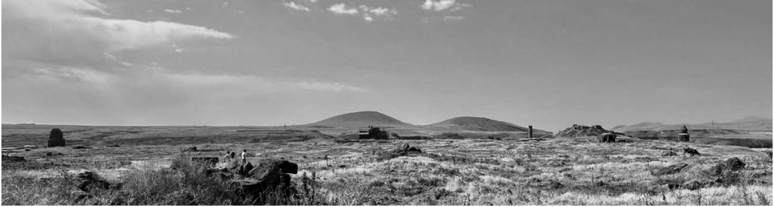
アニ城壁付近から南への遠望。左から救世主協会、アニ大聖堂、マヌチェ・モスク、王宮の高台、アブガムレンツ教会（2025年7月29日）