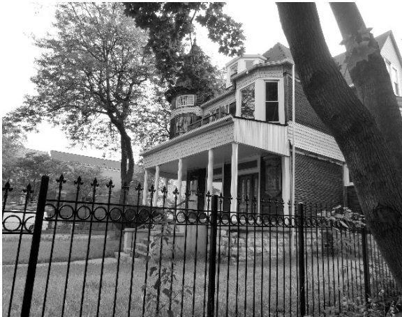
写真1 上 ビクトリア朝の邸宅

K氏は、1955年生まれのアフリカ系アメリカ人の医師である。彼の記憶に残る最初の住居は、両親と兄とともに暮らしたワシントンパークにある2ベッドルームのアパートだった。しかし、両親の離婚により、イングルウッドに移った。