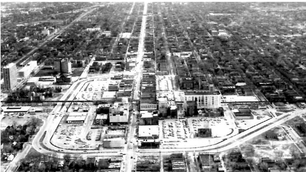
図2 1969年の63通り中心付近図

また、スペシャル・サービス・エリア、セントラル・リテール・マネージメントなどを導入し全体のマネージメント・システムを構築した。さらに、広告、イベント等を促進し、商店街を盛り上げるという提案もなされた。このソーヤ市長によるイングルウッド再生計画において実現したのは、クル・ド・サックになっていた道路を再度車の通れる道路にすることだった。